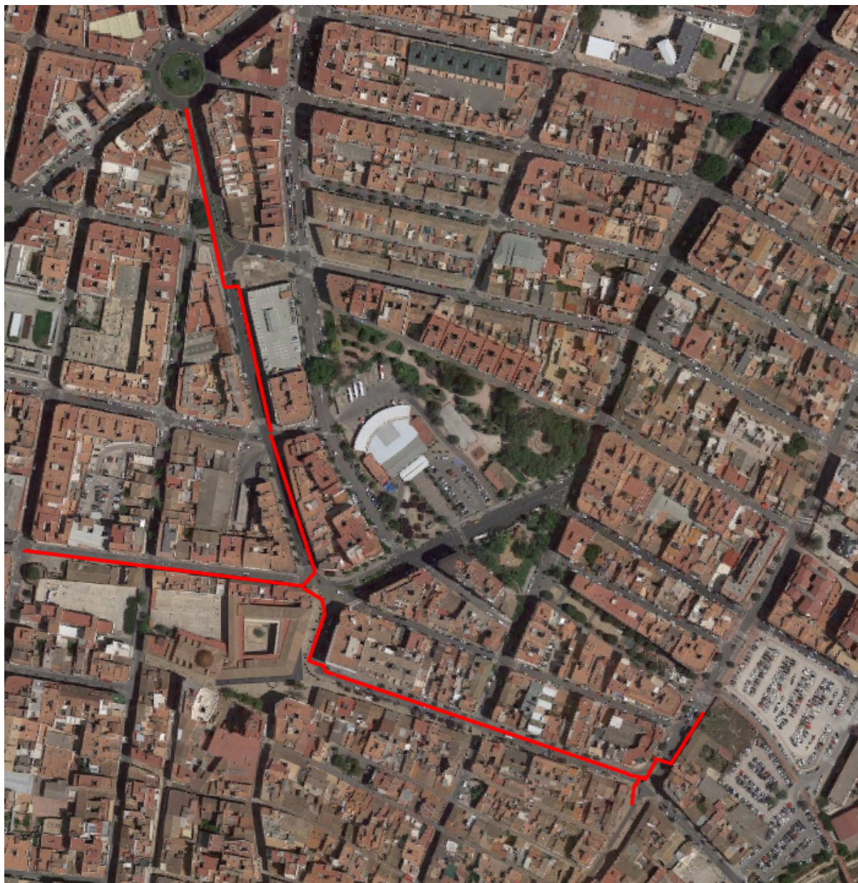
Traçat dels carrils bici