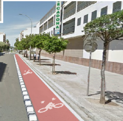
Av. de València

Per què no tindre un carril bici en lloc de cotxes en doble fila?